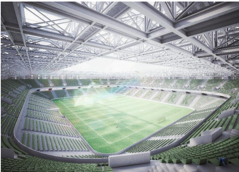
1. Preis: Wohnen im Wildpark Stadion - Karlsruhe

Das Bildmaterial darf kostenfrei unter Angabe des Copyrights nur im Zusammenhang mit der Berichterstattung zum Thema dieser Presseinformation genutzt werden. Wir bitten um ein Belegexemplar.