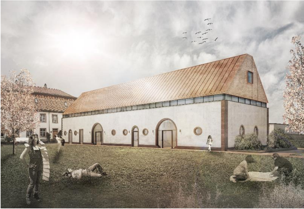
Haftelhof Schweighoven