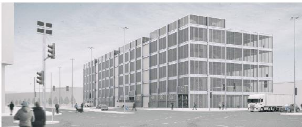
2. Preis: Fernbus-Terminal Berlin West- Aachen