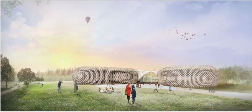
3. Preis: Bionisch-Kinetische Gebäudehülle- Stuttgart © Tzu-Ching Wen