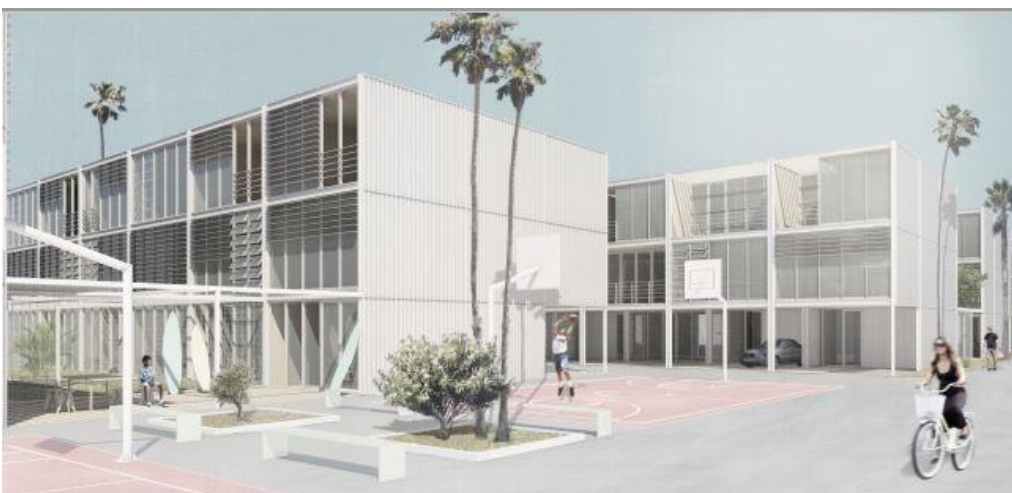
Modularität Wohnungsbau in Santa Monica