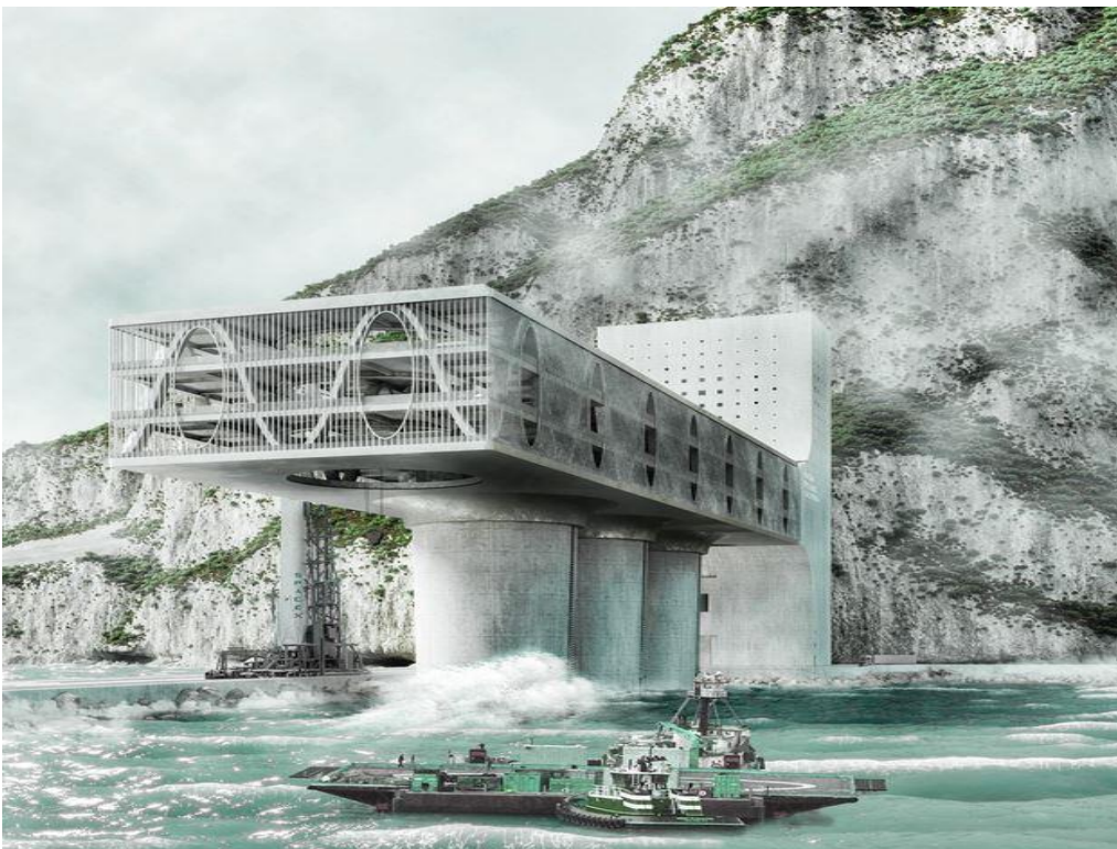
From frontiers to new Lands © Maurice Fabien Nitsche