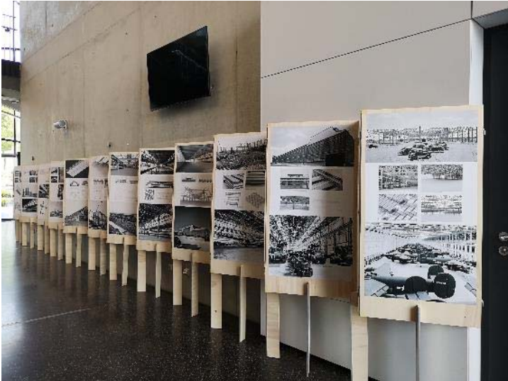
Ausstellung Albert Kahn