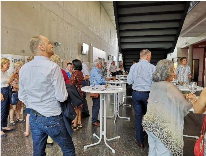
Ausstellungseröffnung Albert Kahn

Das Bildmaterial darf kostenfrei unter Angabe des Copyright nur im Zusammenhang mit der Berichterstattung zum Thema dieser Presseinformation genutzt werden. Wir bitten um ein Belegexemplar.