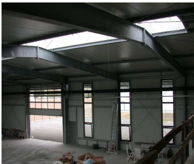
Bild 1: Baufortschritt einer Halle nach Musterstatik bfs e.V. (Innen)

Das vereinfachte Verfahren nach Abschnitt 6 der Muster-Industriebaurichtlinie ist das schnellste zur Verfügung stehende Verfahren. Die im Inneren des Industriegebäudes befindlichen Brandlasten spielen bei der Beurteilung der maximal zulässigen Brandabschnittsfläche, sowie der Feuerwiderstandsfähigkeit der tragenden und aussteifenden Bauteile keine Rolle. Dadurch ist die Nutzung der Halle flexibel und hat keine Einschränkungen bis auf die Lagerguthöhe. Damit ist eine Risikobetrachtung der baulichen Anlage nicht notwendig, das Brandereignis nach der Einheits-Temperaturzeitkurve richtet. Diese Vereinfachung bietet zwar die Möglichkeiten, die Nutzung der Halle problemlos zu ändern, jedoch zu Lasten der Brandabschnittsfläche. Sobald die Größe der Halle diese Werte übersteigt, sind höhere Anforderungen an die Tragkonstruktion und die brandschutztechnische Infrastruktur notwendig; und damit letztendlich auf Kosten der Wirtschaftlichkeit. Falls das Verfahren nicht zielführend ist kann das vollumfänglich Verfahren nach Abs. 7 angewendet werden.