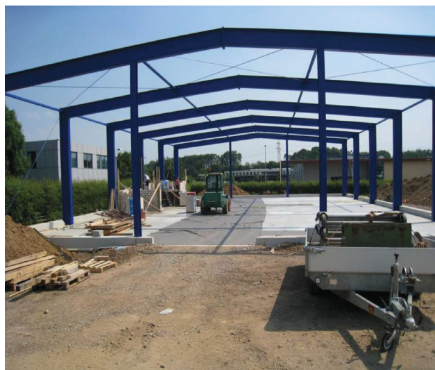
Bild 2: Baufortschritt einer Halle nach Musterstatik bfs e.V. (Außen)