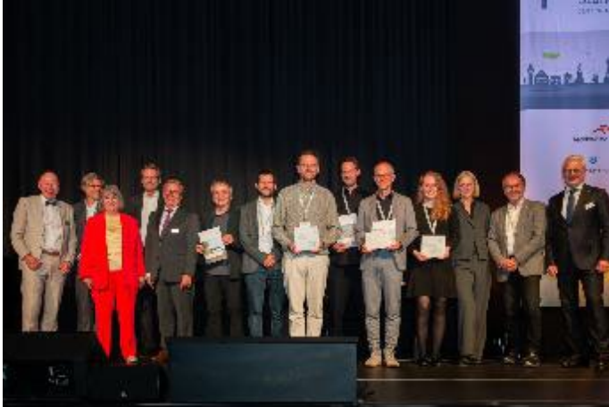
Foto 1 (Alle Preisträger auf der Bühne) „Bühnenreife“ Leistungen: die Preisträger des 41. Deutschen Stahlbautags in Lindau.